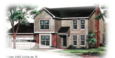
Page 1463 Living sq. ft. To view the Standard Specifications